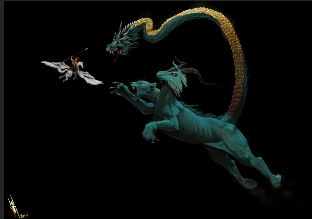
Quimera, Javier Moreno (2019).