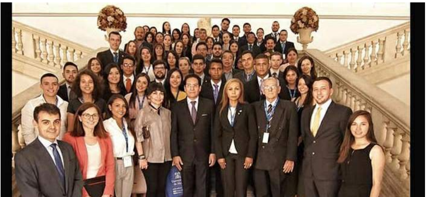
Participantes y equipo coordinador del Moot